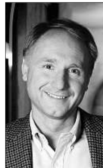
Dan Brown, 45, l'autur da tants grondius thrillers.